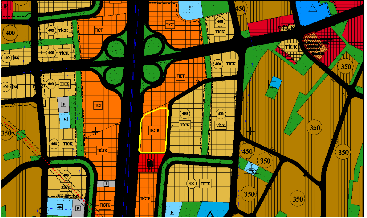
MEVCUT 1/5000 ÖLÇEKLİ NAZİM İMAR PLANI